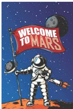
Programme de Mars 2020